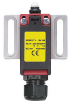
Концевой выключатель однофазный